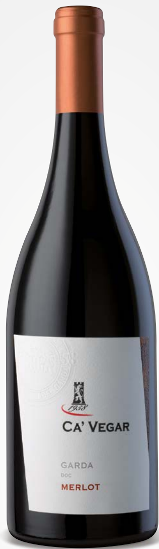
Ca' Vegar GARDA DOC MERLOT